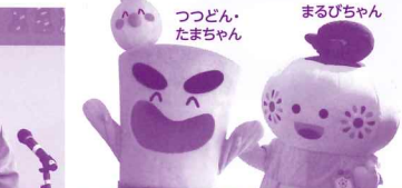
つつどん・たまちゃん