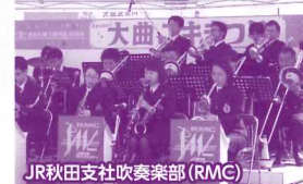
JR秋田支社吹奏楽部(RMC)