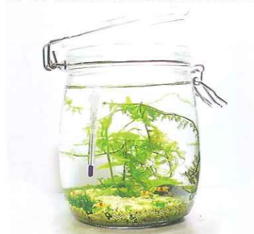
179 800R(ワイヤーロック式) 4,320円

●容量/800ml ●サイズ/幅100mm、高さ145mm ※レッドベージュシリンドリッドがメインのボトルとなります