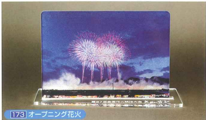
173 オープニング花火

写真の特徴をいかながら特殊データを作成して、きらめかせる為に濃淡は人の手、臨場感人の目で一点一点煌めき感を確認しながら表現します。