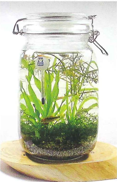
180 1500(ワイヤーロック式) 6,480円

●容量/800ml ●サイズ/幅100mm、高さ145mm ※レッドベージュシリンドリッドがメインのボトルとなります