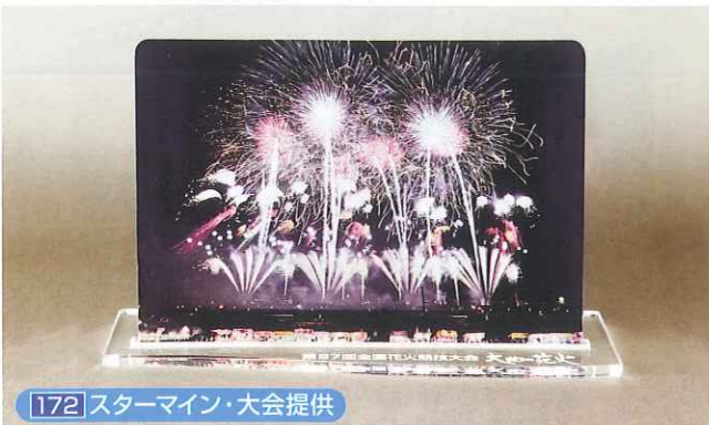
172 スターマイン