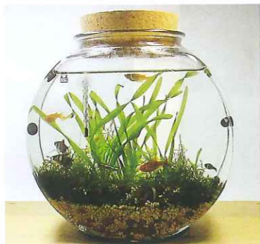
177 3800(タイコ型) 15,000円

●容量/3800ml ●サイズ/幅約210mm、奥行き130mm、高さ215mm