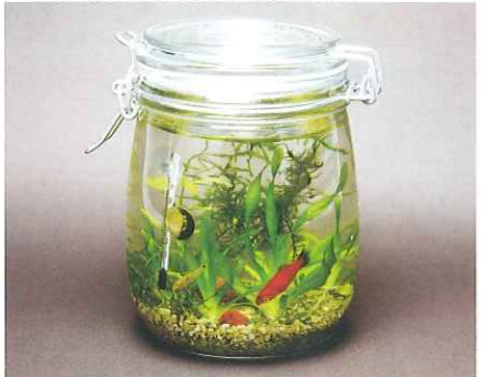
178 800(ワイヤーロック式) 3,780円

●容量/3800ml ●サイズ/幅約210mm、奥行き130mm、高さ215mm