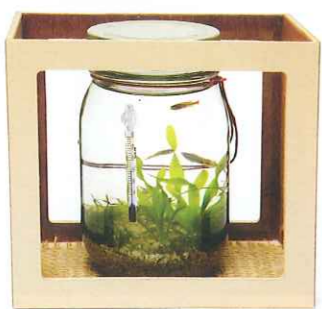
176 475木枠付(円筒型) 3,240円