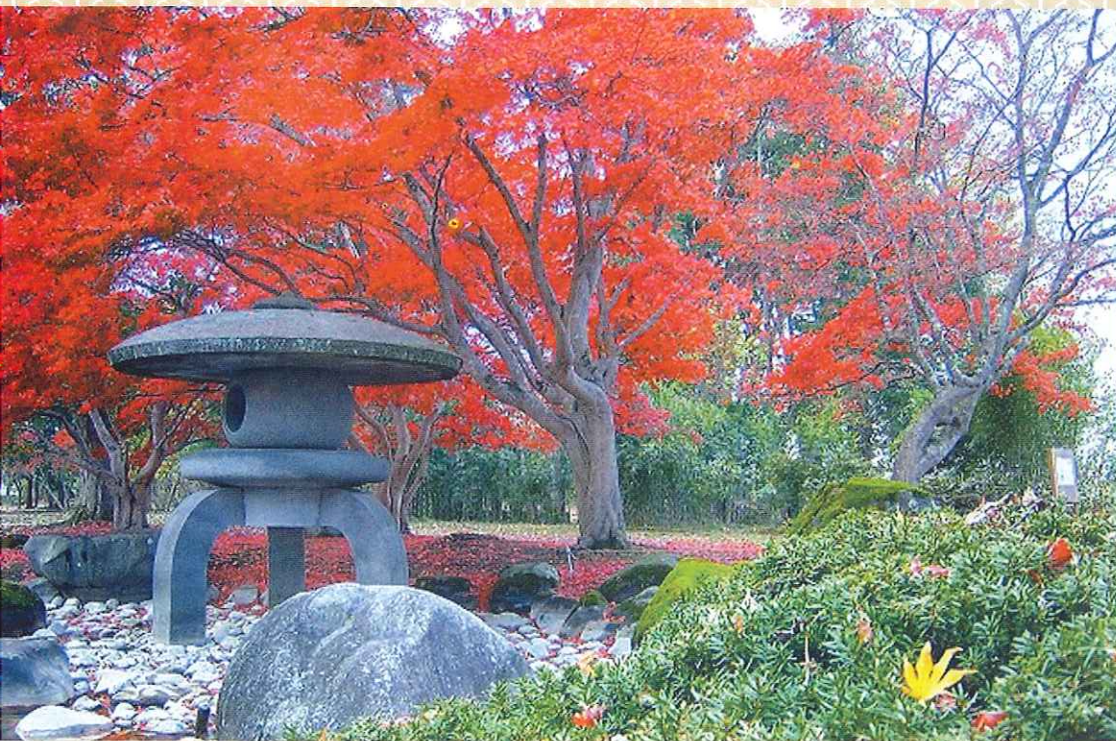
旧池田氏庭園 主庭